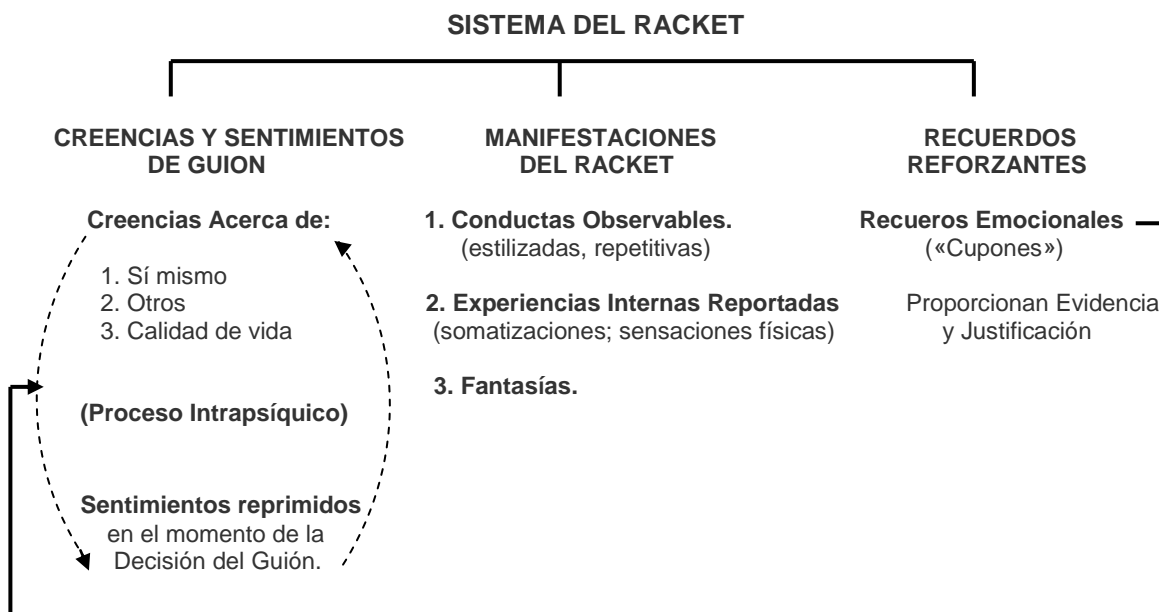
Figura 1 El Sistema del Racket

Cuando un recuerdo es distónico con una Creencia de Guión específica, la persona puede, en lugar de distorsionar el recuerdo, simplemente negarlo cambiándose a otra Creencia de Guión. En el ejemplo anterior la persona distorsionó el recuerdo de «Tú me gustas» diciendo que la declaración del terapeuta carecía de sentimiento; la persona también podría cambiar a otra Creencia de Guión, «No se puede confiar en la gente». En el cambio, se niega el recuerdo que desafía la Creencia de Guión y la persona sigue estando triste, el pensamiento sigue siendo contaminado y está en guión.